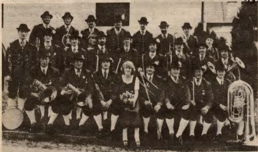
Das ist die Musikkapelle Wippenham, die am Wochenende ein Jubiläum feiert.