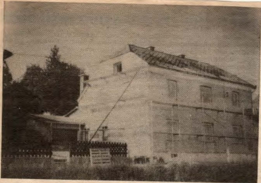
Das Wippenhamer Arzthaus erhielt nun eine neue Fassade.