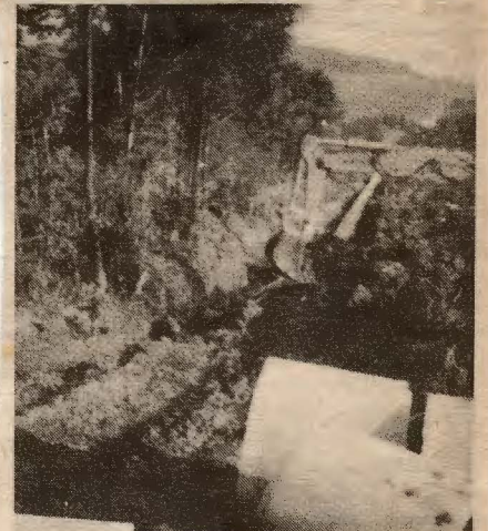
Wie ein kleines Schlachtfeld mutet derzeit das Areal für die neue Sportplatzanlage Wippenham an, durch das eine Rohrleitung gelegt werden muß. 34

WIPPENHAM. — In der letzten Woche wurde bei der neu zu er- richtenden Sportplatzanlage die Verrohrung des diagonal durch- fließenden Rinnsales mit Rohren von 1 Meter Durchmesser durchge- führt. Die Arbeiten gestalteten sich etwas schwierig, da dieses Grund- stück an und für sich naß ist und durch die letzten Regenfälle fast unzugänglich war. Eine Drainage zur Trockenlegung wird teilweise nötig sein. Für die Abholzung der Bäume, die auf einer Seite des Areal stehen, haben erfreulicher- weise Männer der Feuerwehr sowie sportbegeisterte Wippen- hamer unentgeltlich ihre Hilfe an- geboten. Die Gesamtkosten des Sportplatzneubaues, dessen Fertig- stellung voraussichtlich nicht vor Herbst 1981 sein wird, werden ca. 500.000 S betragen. Wie Bür- germeister Weibold versicherte, sind diese hierfür aufzubringenden Mittel aber bereits gesichert. 33