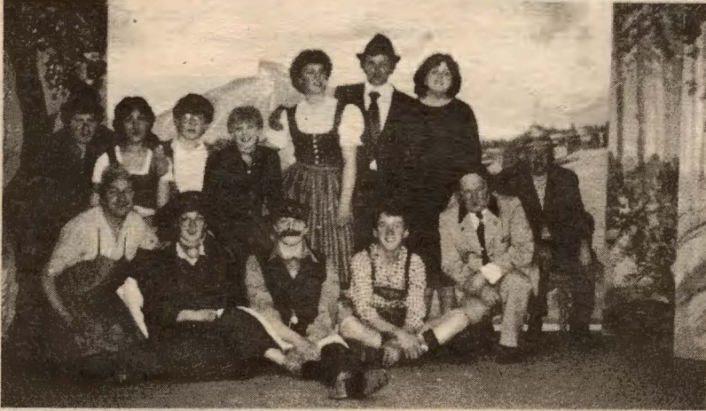
Die Theaterspielgruppe Wippenham, die am kommenden Wochenende das Lustspiel in drei Akten „Der hilfreiche Antonius“ im Gasthaus Kreuzhuber zur Aufführung bringen wird. Spielzeiten: Samstag, 14. 3., 14 Uhr, und Sonntag, 15. 3., 14 und 20 Uhr.