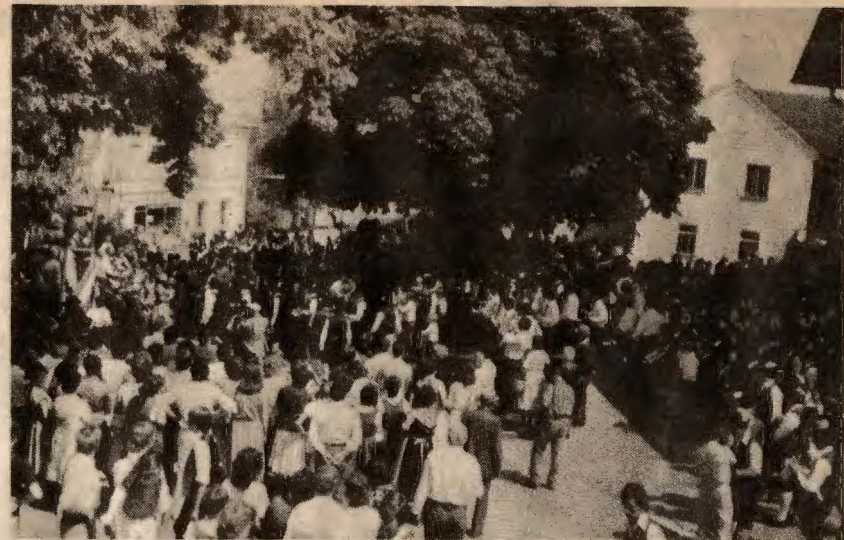
Beim Wippenhamer Kirchenplatz waren an diesem Sonntag besonders die schattenspendenden Bäume umlagert.