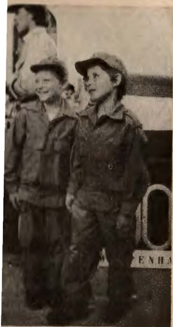
Die Jüngsten sind vom Feuerwehren schon restlos begeistert und sind, wie dieses Bild be-